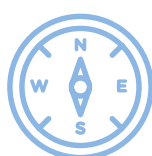
Ethics and Compliance-pagina's op Pulse